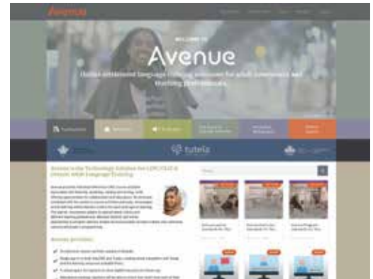
Page d'accueil d'Avenue.ca

Avenue est une solution moderne qui englobe les quatre compétences pour la formation linguistique en ligne, hybride ou mixte. Depuis Avenue, il est également possible de se connecter à Tutela, offrant ainsi l'accès à des centaines de ressources d'apprentissage conçues au Canada pour LINC, CLIC et la formation linguistique pour adultes en Ontario. Le système de gestion de l'apprentissage (SGA) d'Avenue fonctionne sur Moodle et inclut de nouvelles activités et applications personnalisées, telles que le Constructeur de cours automatisé.