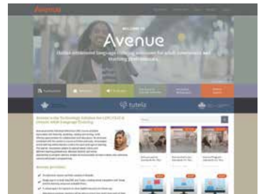
Page d'accueil d'Avenue.ca

Le projet LearnIT2teach, soutenu par Immigration, réfugiés et citoyenneté Canada (IRCC) et le Ministère du travail, de l'immigration, de la formation et du développement des compétences (MTIFDC) de l'Ontario, offre aux instructeurs et aux gestionnaires de LINC, CLIC et de la formation linguistique des adultes de l'Ontario, les outils et la formation nécessaires pour intégrer l'apprentissage des langues optimisé par la technologie (ALOTech) dans leurs cours et programmes. Les normes récentes pour les apprenants, les instructeurs et les programmes d'Avenue pour ALOTech sont intégrées dans toute la formation. Un soutien technique (Live Help) est disponible pour tous.